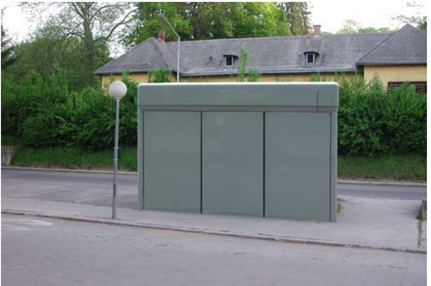
Entwurf für eine Bushaltestelle Simulation, 2003