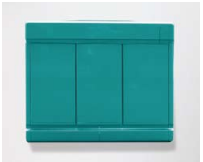
Maserati, Lotus, Porsche, Bennetton-BMW, Badezimmerschrank, Autolack, Simulation, 2005