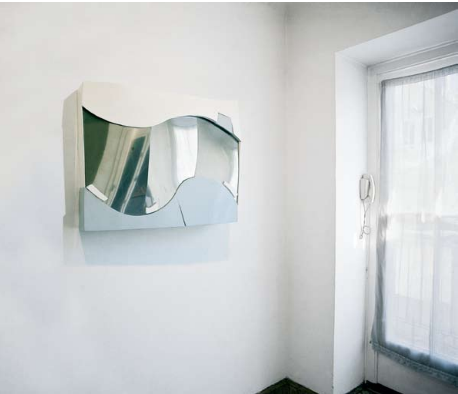
Strange Allibert 2 verschiedene Materialien, 2003