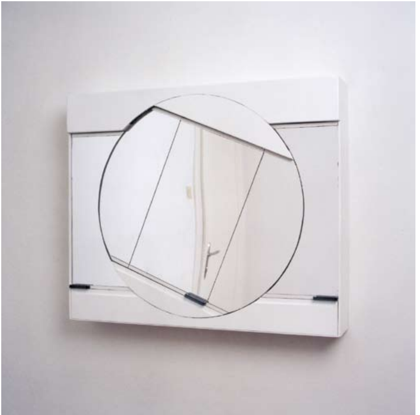
Strange Allibert verschiedene Materialien, 2002